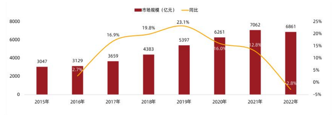
图 1 中国生活美容服务业市场规模

业新工种以来，两年间皮肤管理服务在全国范围内共实现营业收入近 3900 亿元，带动就业人数增长约 62 万人，仅上海一地已突破 4.6 万人。拥有 1+X 皮肤护理证书的学生因其掌握皮肤管理专业技术，不仅有良好的就业前景，而且有稳定的收入，工龄 3 年以上的皮肤管理师平均年收入过 10 万。而且随着经验的积累，皮肤管理师薪资呈稳步上升的趋势。皮肤管理师正逐渐成为美业产业稳就业、保民生、促经济的重要引擎。